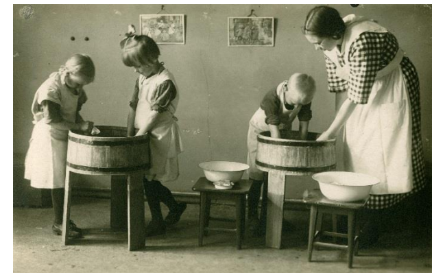
Lapset pesevät nukenvaatteita Ebeneserissä 1920-luvulla.

Oppimisen alueet / oppimiskokonaisuudet: Kielten rikas maailma, Minä ja meidän yhteisömme