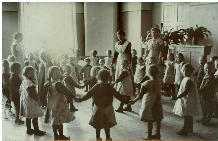
Lapset leikkimässä piirileikkiä Ebeneserissä vuonna 1910.